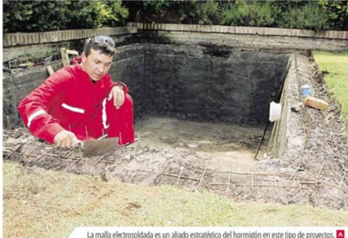
La malla electrosoldada es un aliado estratégico del hormigón en este tipo de proyectos. A

De acuerdo a su rendimiento en obra, el que alcanza entre 9 a 11 m 2 , dependiendo del traslazo necesario, se recomienda su utilización en la construcción de piscinas medianas de hasta 1,5 metros de altura.