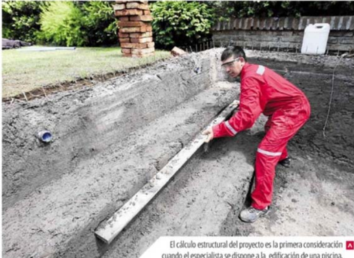
El cálculo estructural del proyecto es la primera consideración cuando el especialista se dispone a la edificación de una piscina.